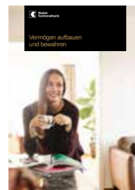
Vermögen aufbauen und bewahren