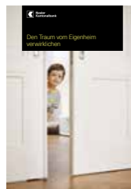
Den Traum vom Eigenheim verwirklichen