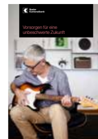
Vorsorgen für eine unbeschwerzte Zukunft