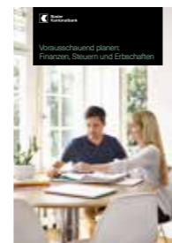
Vorausschauend planen: Finanzen, Steuern und Erbschaften