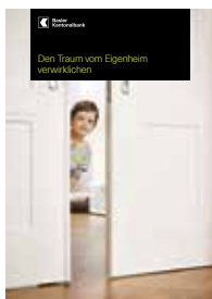
Den Traum vom Eigenheim verwirklichen