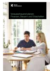
Vorausschauend planen: Finanzen, Steuern und Erbschaften