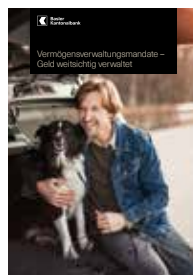
Vermögensverwaltungsmandate – Geld weitsichtig verwaltet