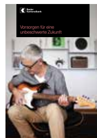
Vorsorgen für eine unbeschwertere Zukunft