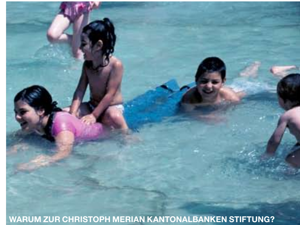
WARUM ZUR CHRISTOPH MERIAN KANTONALBANKEN STIFTUNG?

Investieren auch Sie in eine positive Zukunft.