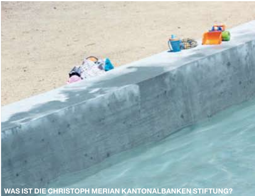
WAS IST DIE CHRISTOPH MERIAN KANTONALBANKEN STIFTUNG?

Die Christoph Merian Kantonalbanken Stiftung ist eine 2008 von der Basellandschaftlichen Kantonalbank, der Basler Kantonalbank und der Christoph Merian Stiftung gegründete gemeinnützige Stiftung. Sie bietet eine breite Palette von Möglichkeiten, sich für die Region Basel zu engagieren.